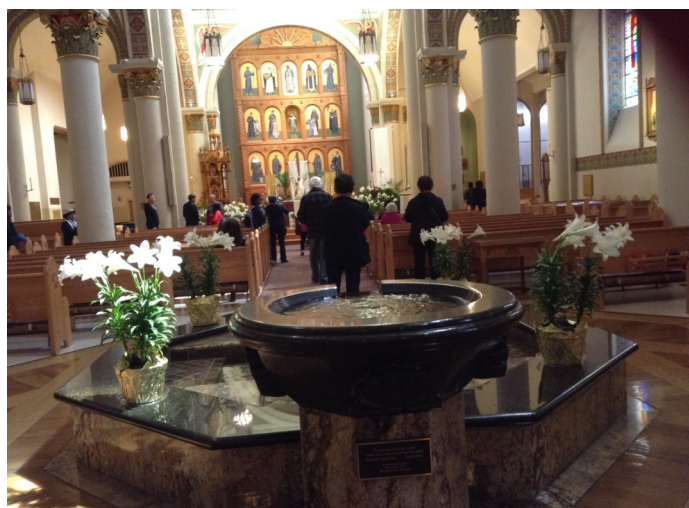
San Miguel 聖堂內