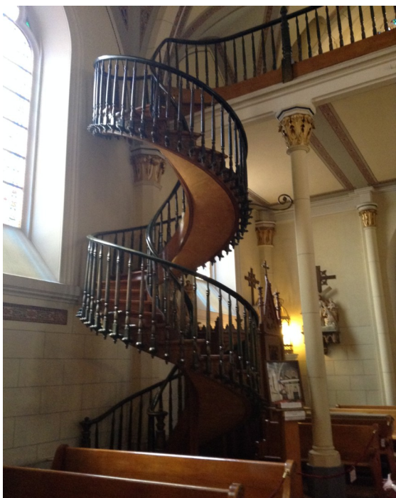
光明之母聖堂奇跡樓梯